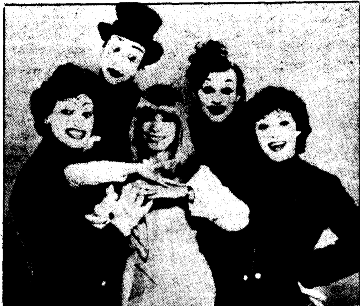
SEGUNDO LUGAR. La cantante alemana Katja Ebstein, representó a la República Federal de Alemania en el Festival Interpreto la canción «Theater». En la foto.