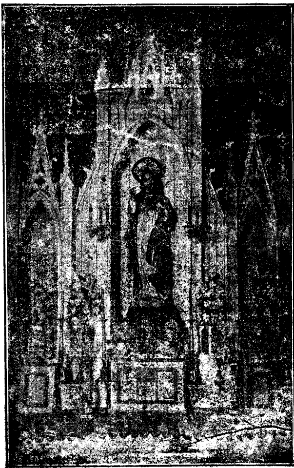
NUUESTRO GRABADO Una Obra de arte colonial: Altar del Sagrado Corazón de Jesús de la antigua Iglesia de Elobey.

SUMARIO. Portada, nuestro grabado—Santoral—Un glorioso centenario—Deudas y deudores—La poda del árbol del cafeto—De la Colonia—Noticias de la Colonia; de Santa Isabel—Radios de prensa.