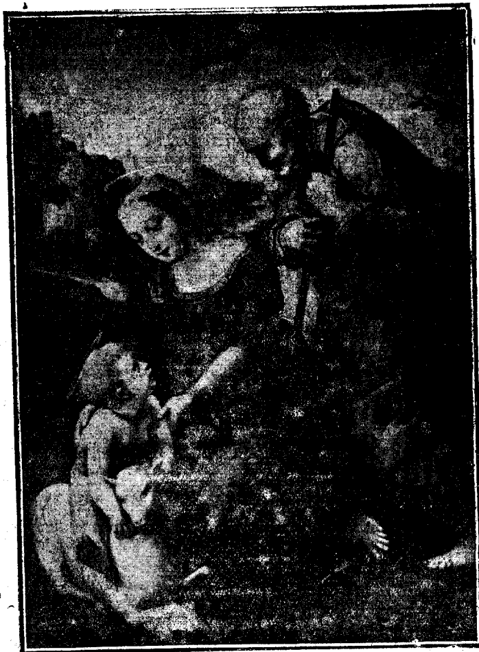
Un simbolismo de Navidad

SUMARIO. Portada un simbolismo de Navidad— Santoral — Navidades — Una en- demia — Los siete pecados capitales del comerciante — Comunicado — Noticias de la Colonia; de Santa Isabel — Radios de prensa.