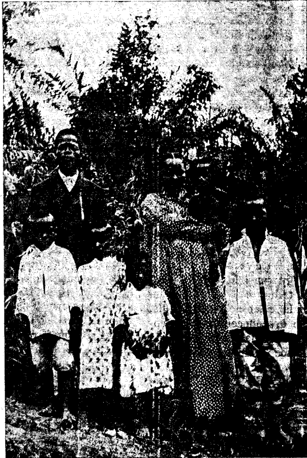
AFRICA — TIPOS DEL CONGO

SUMARIO. Portada, nuestro grabado—Santorral—Ahí debemos formar todos.—Estudio Botánico del Quino—Noticias de la Colonia: de Santa Isabel, de Bata y Evinyong—Radios de prensa—Aviso de I a Caifer, S. A.