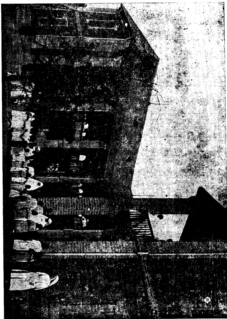
La nueva Casa de S. Rafael Ambohitrarino (Madagascar.)