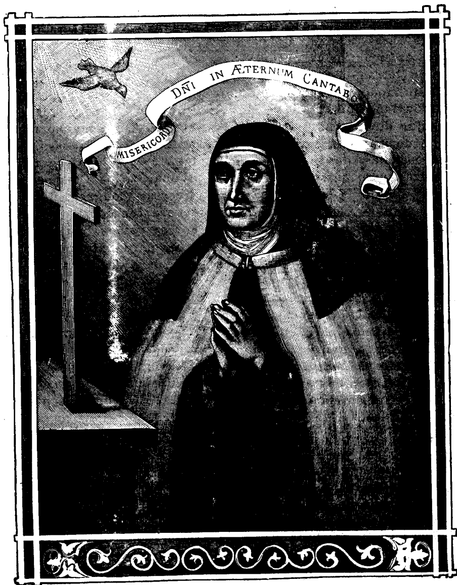
La Doctora del Carmelo, Santa Teresa de Jesús