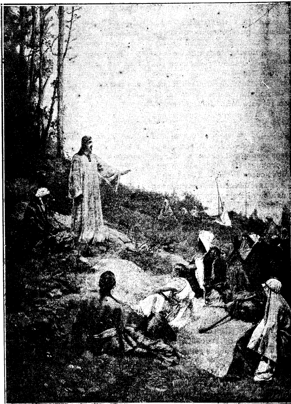
JESÚS PREDICANDO A LAS TURBAS.