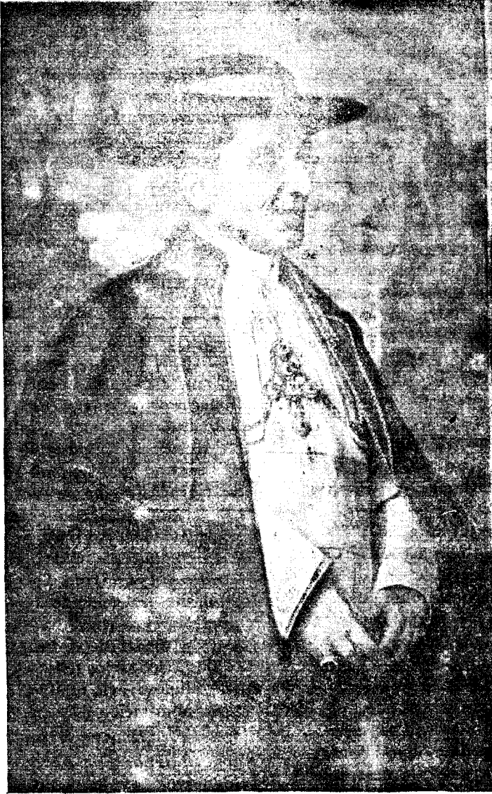
SU SANTIDAD BENEDICTO XV (R. I. P.)

Precios de subscripción: en la Colonia, 10 ptas. al año.—Fuera de la Colonia 12 id. Certificada en la id. 1750 id. id. — id. Certificada 20 id. Número suelto 0.50 id. atrasado una peseta. — Existen Colecciones.