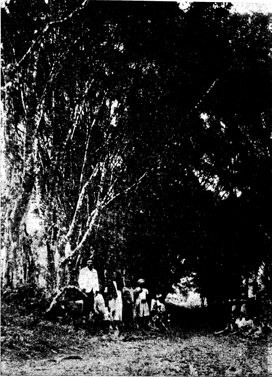
Antigua entrada en el poblado de Moka.