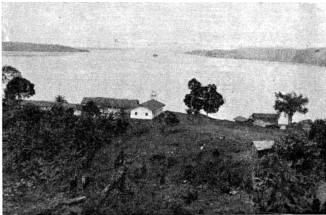
Vista de Kogo

AÑO XLI—25 de Noviembre de 1945 —N.º 1209