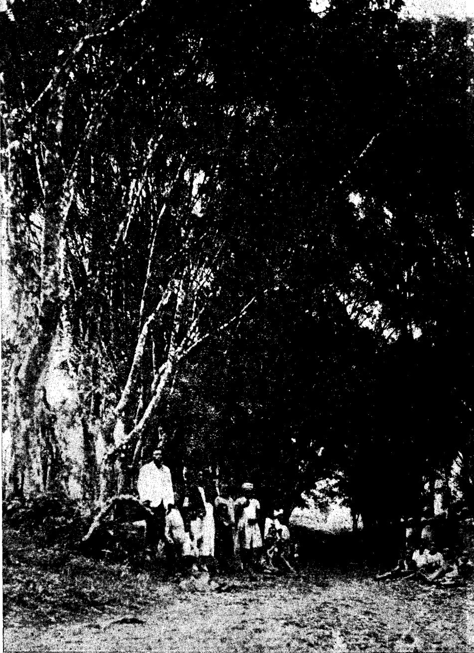
Antigua entrada en el poblado de Moka.