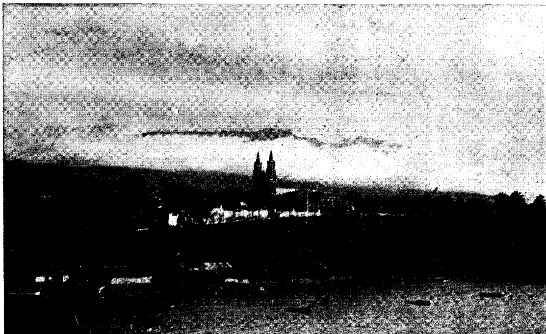
Bahia de Santa Isabel

AÑO XLI—10 de Noviembre de 1945—N.º 1208