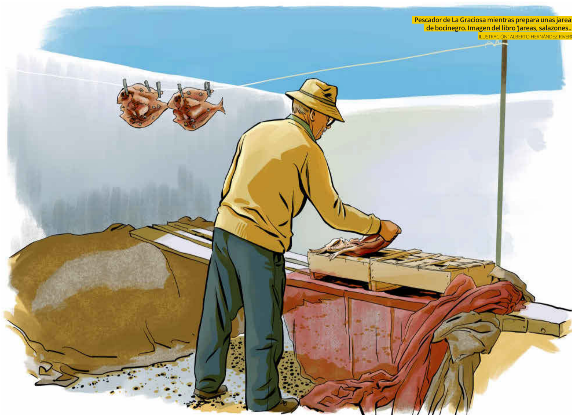
ILUSTRACIÓN: ALBERTO HERNÁNDEZ RIVERO

Pescador de La Graciosa mientras prepara unas jareas de bocinegro. Imagen del libro 'Jareas, salazones...'