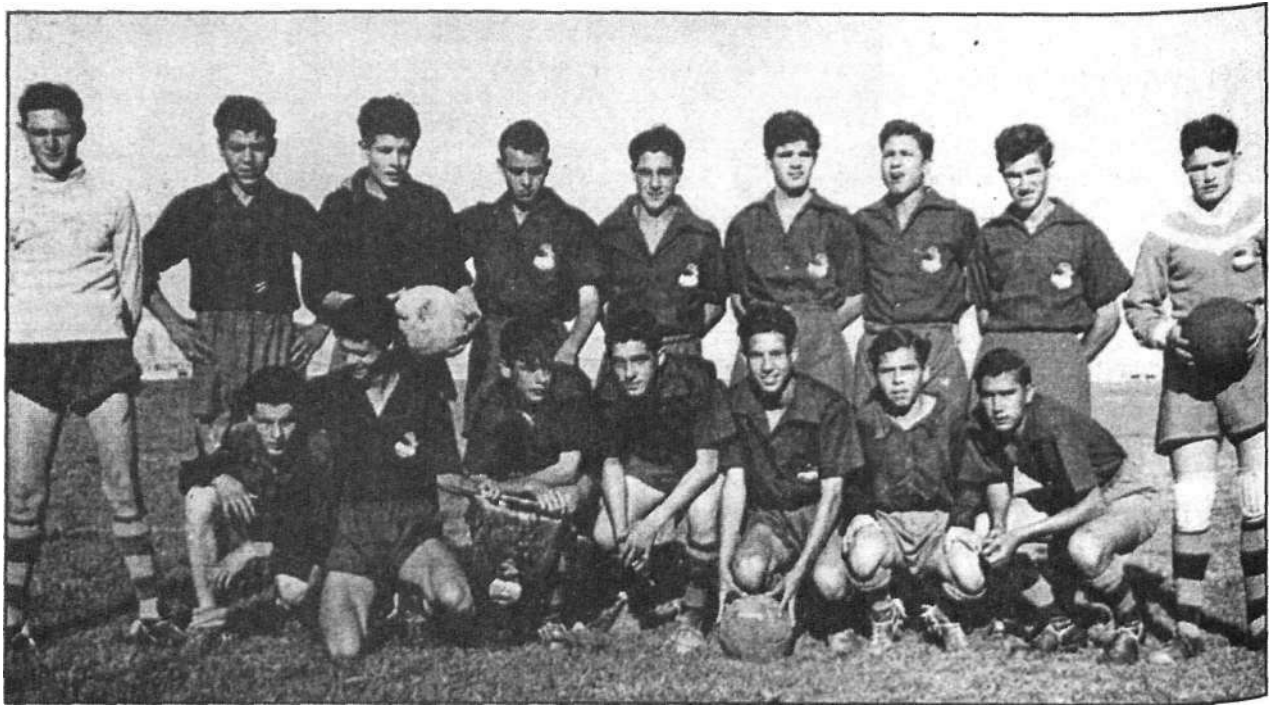
Juvenil Real Unión de Tenerife (1955).

Con estos resultados, queda campeón del Torneo el Real Unión. Al final entrega de Trofeos con