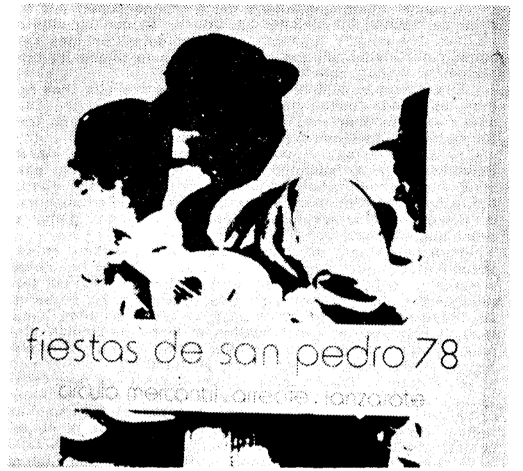
fiestas de san pedro 78

En el apartado deportivo, se incluyen diferentes competiciones y variadas modalidades dentro del balonmano, baloncesto, fútbol-sala, balonvolea, bolas y natación. Los días de celebración se especifican para cada uno de ellos, aunque están todos enmarcados en el mes de junio. Aparte y dentro de los locales, se enfrentaron dos selecciones, Norte y Sur de lucha canaria. Esta luchada en terrero acolchonado tuvo lugar en la tarde del día 16. Igualmente el día 25 y teniendo como marco la avenida de la Mancomunidad, se celebrará una extraordinaria