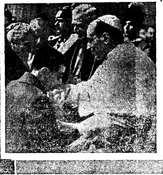
Y recibir cariñosamente a un joven a quien la guerra arrancó los ojos...