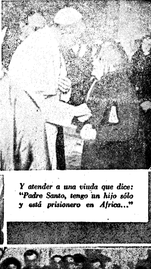
Y atender a una viuda que dice: "Padre Santo, tengo un hijo sólo y está prisionero en Africa..."