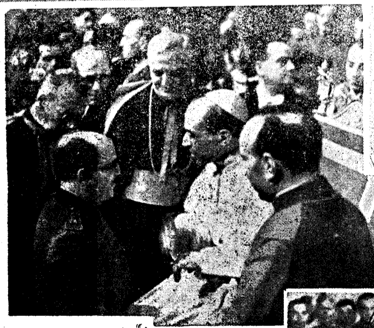
Y escuchar el relato de un mutilado...