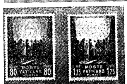
Y crear sellos para ayudar a las víctimas del huracán bélico