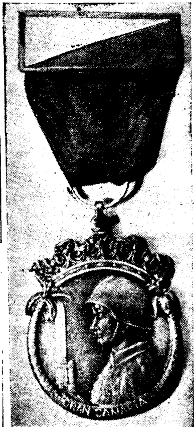
LA MEDALLA DEL EX COMBATIENTE CANARIO

Educar las nuevas generaciones en el modo de ser de la Falange es obligación ineludible del Magisterio.