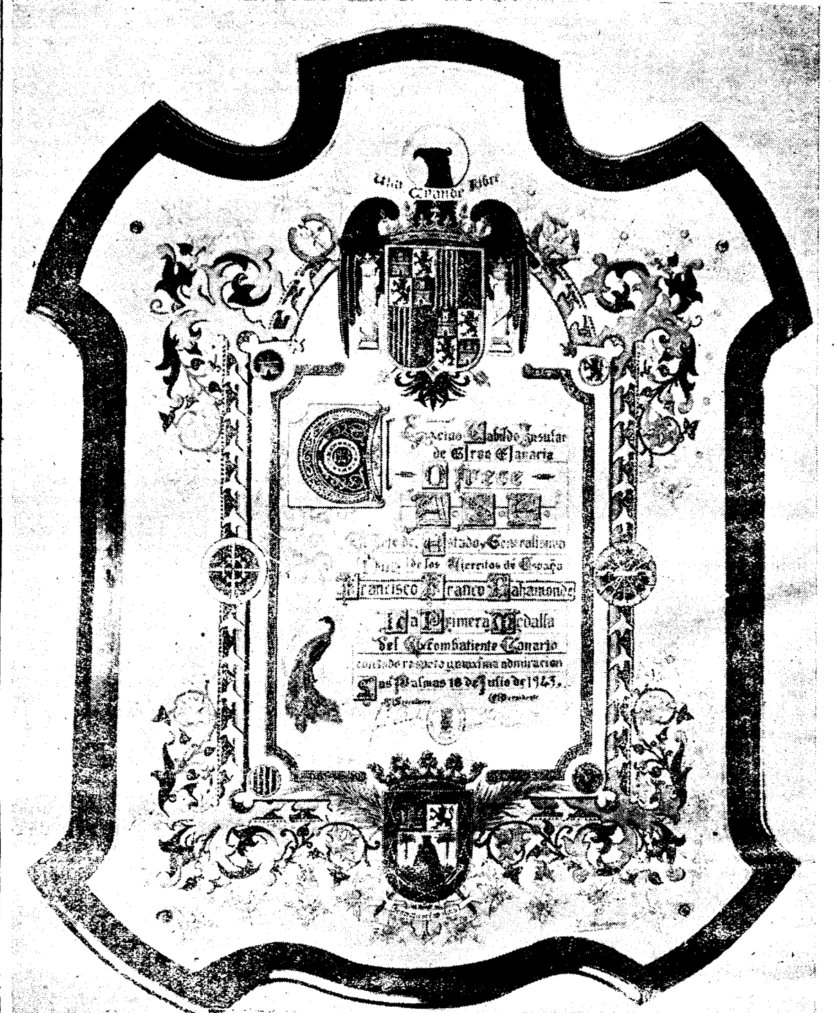
Precioso pergamino con el que se hace entrega al Caudillo de la Medalla del Excombatiente Canario.

Aparatos "Liberator" y "Halifa" bombardearon el campo de aviación de Crotone, también situado en el sur de Italia, en la noche del 15 al 16 de julio. No regresaron tres bombarderos.—(Efe).