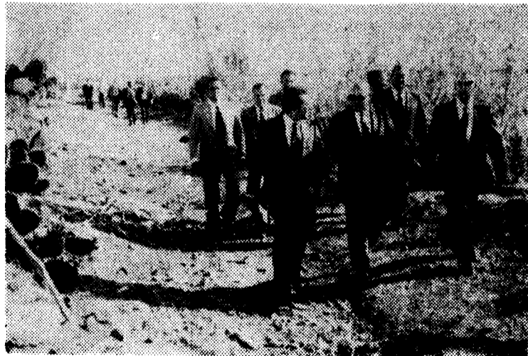
El gobernador civil y jefe provincial del Movimiento, señor Martínez-Cañavate y restantes personalidades recorren la zona de El Matorral.

La postura de la primera autoridad de la Provincia fue en todo momento caballerosa. Una vez más hizo gala de ese talante que encierra su persona. El quiso el diálogo, pero unos vecinos mal aconsejados no lo aceptaron. Una prueba de que siempre acepta el diálogo amistoso lo puso de relieve en el Castillo del Romeral y el Matorral, donde aceptó peticiones y sugerencias de problemas y necesidades. Pero solicitadas como sabe hacerlo el buen pueblo canario: sin estridencias ni malos modos, con hidalguía y entendimiento.