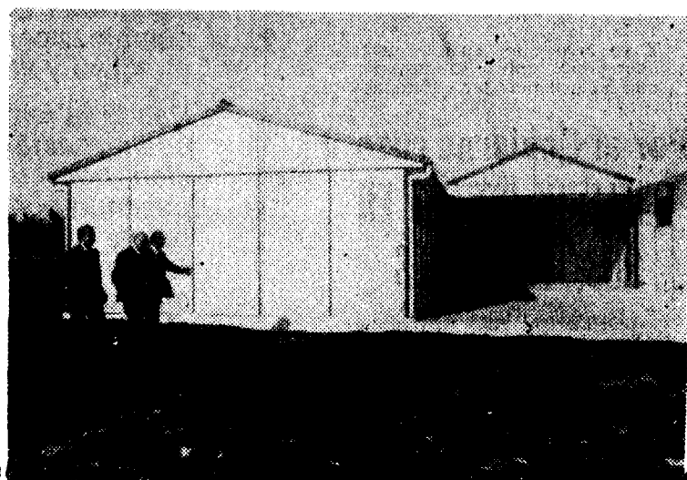
Las cuatro unidades de E.G.B. inauguradas en El Matorral.